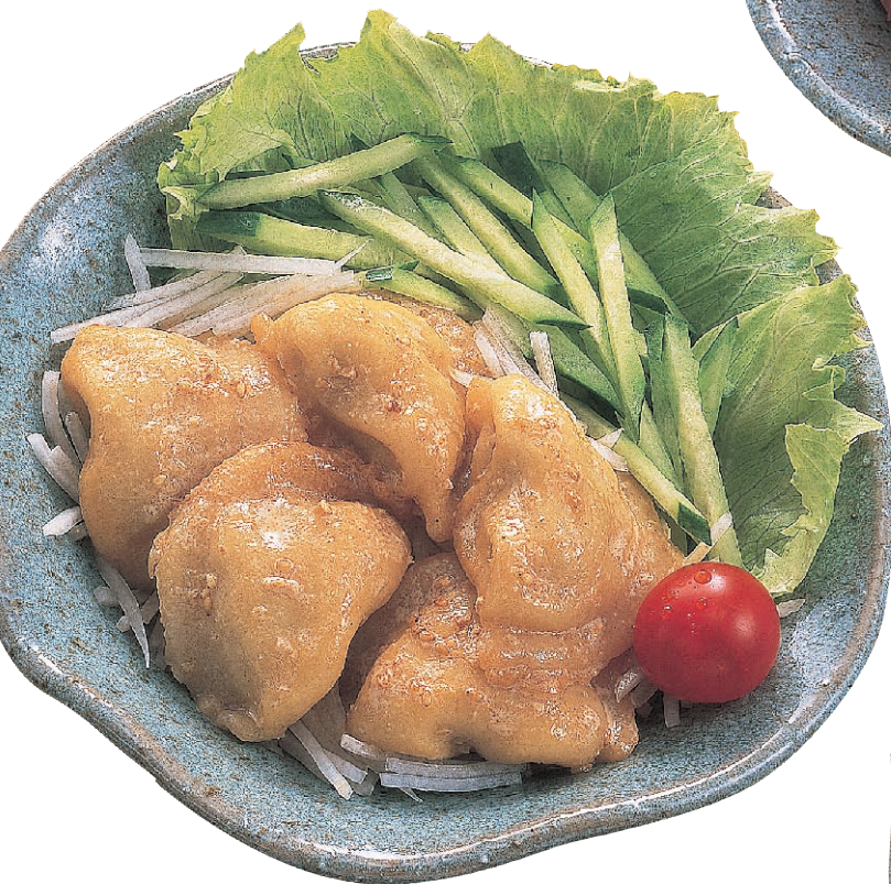
マヨジャン・水餃子サラダ [韓国ヤンニョムドレッシング] 600円(税630円)