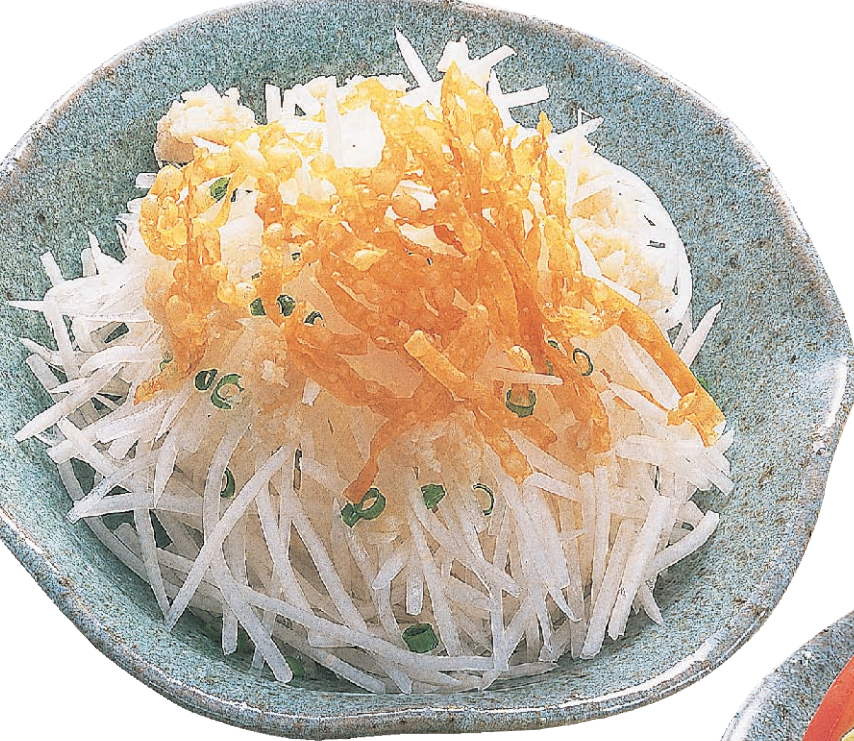
帆立入り大根サラダ 650円(税682円) [大根サラダ用和風ドレッシング]

新鮮な野菜をたっぷり使ったヘルシーサラダ。 シャキシャキとした歯ごたえのサラダを、 オリジナルドレッシングでさっぱりとお召し 上がり下さい。